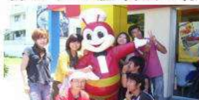
有名なハンバーガー店ジョリビー