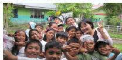
元気いっぱいの子供と交流