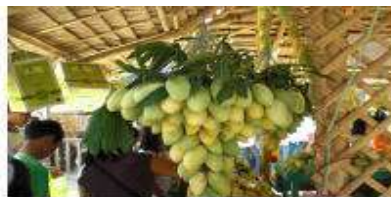
ギマラス島はマンゴー名産地