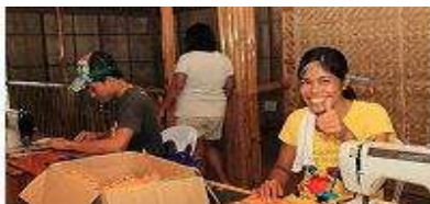
フェアトレード生産者訪問

キャンプ中に嬉しかったこと、びっくりしたこと、大変だったこと、悩んだこと、これらは全てあなたの経験に基づいた「感動体験」です。一緒に過ごした仲間とこの経験を共有して下さい。プレゼンに向けて、スタッフが英語の作文作り、パブリックスピーチの方法をお手伝いします。