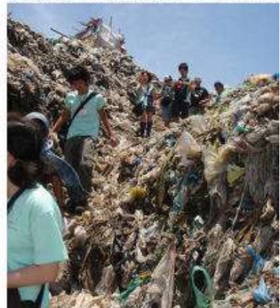
急成長する都市部のごみ山