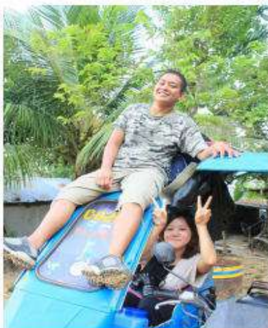
たくさんのことを教えてくれる青年リーダー