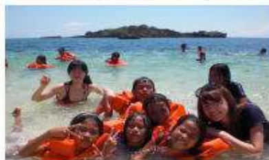
美しいサンゴ礁に囲まれた村