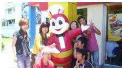
有名なハンバーガー店ジョリビー