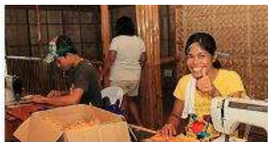
フェアトレード生産者訪問

【LOOB の活動理念 2】 コミュニティ開発、社会活動、自立支援などの協プログラムを実施することにより、フィリピンと日本の参加メンバーの奉仕精神を育てる。