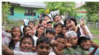
元気いっぱいの子供と交流