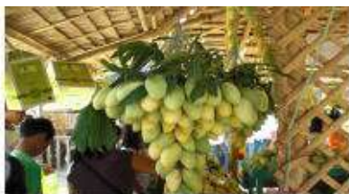
ギマラス島はマンゴー名産地