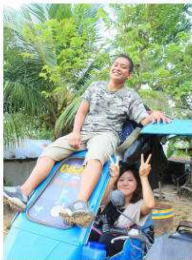
たくさんのことを教えてくれる青年リーダー