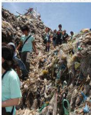
急成長する都市部のごみ山