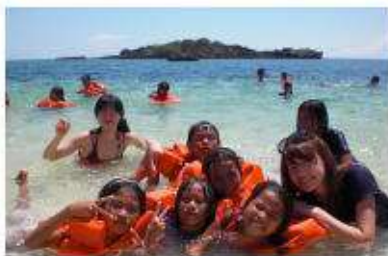
美しいサンゴ礁に囲まれた村