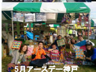
5月アースデー神戸