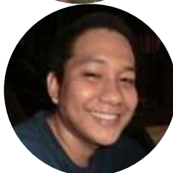
ER君 フィリピンボランティア