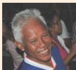
Roy (コーディネーター)