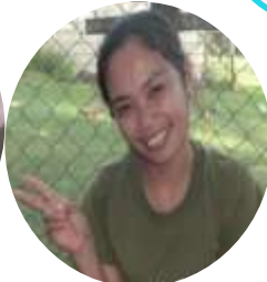
Bobblesちゃん フィリピン人ボランティア