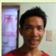
Tonton (Jonaの弟。 調理スタッフ)