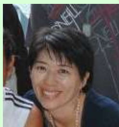
ゆきえ (コーディネーター)