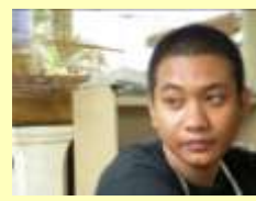
ER (LOOBハウスの ご近所さん)