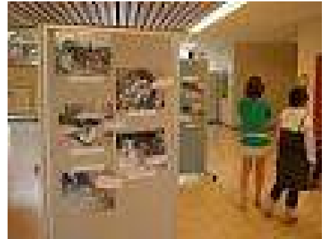
秋田国際教養大学での写真展

はじめに応じてくれたのは、秋田県国際教養大学のService Travelさん。大学の環境イベントの中で、『ごみを考える写真展』というタイトルで、スモ山の写真展を開いてくれました。スモ山の写真展はお客さんたちへの大きなインパクトとなり、「環境問題に対して私たちが何かしなきゃ！」と、反応も上々だったようです。