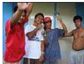
LOOBの大エスタフたち